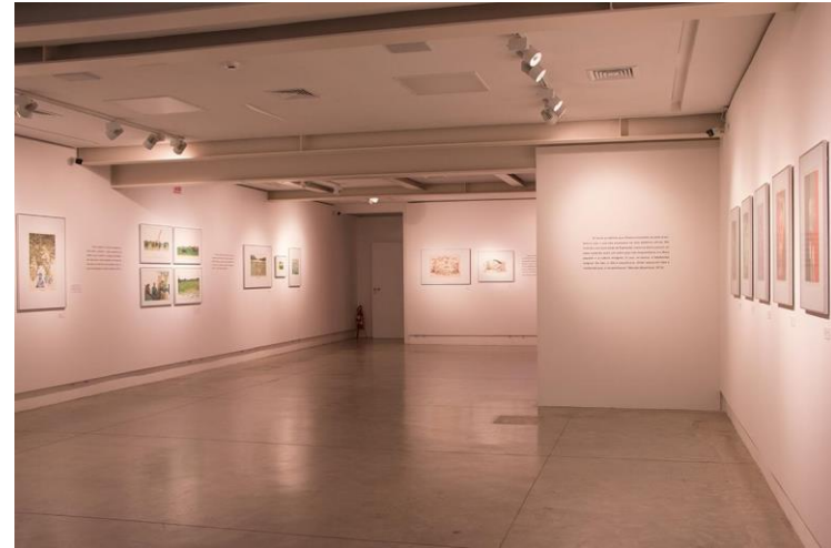
Exposição “Glauco Rodrigues: Entre trânsitos”.