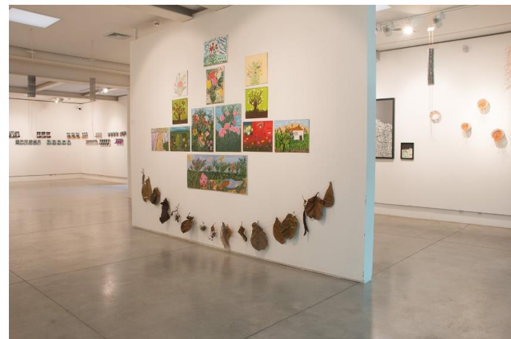
Exposição “Sobre Minha Mãe”, de Ricardo Ramos.