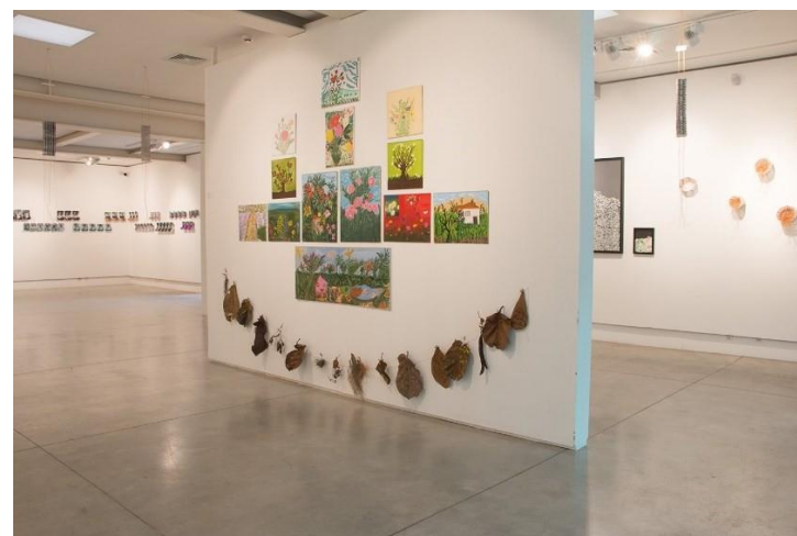
Exposição “Sobre Minha Mãe”, de Ricardo Ramos.