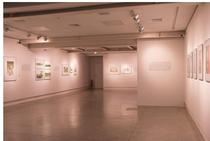
Exposição “Glauco Rodrigues: Entre transitos”.